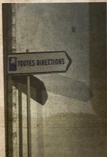
En face, les  tablissements scolaires Saint Laurent et Saint Clair, un panneau est apparu la semaine derni re.